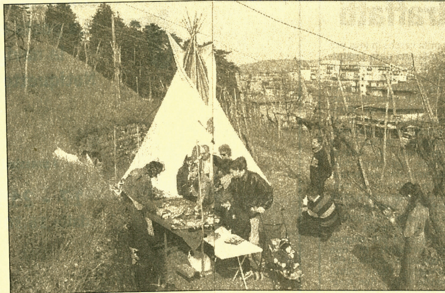
I bresciani hanno visto anche un accampamento indiano nel vigneto di via Pusterla