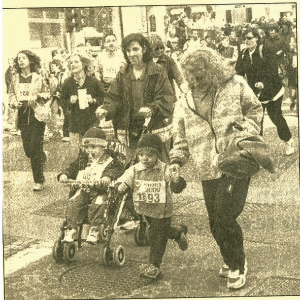
Grandi e piccoli hanno partecipato a «Viv

Dai giocolieri di piazza Loggia ai giochi medioevali nel Parco Gallo. Intere famiglie a «Viv